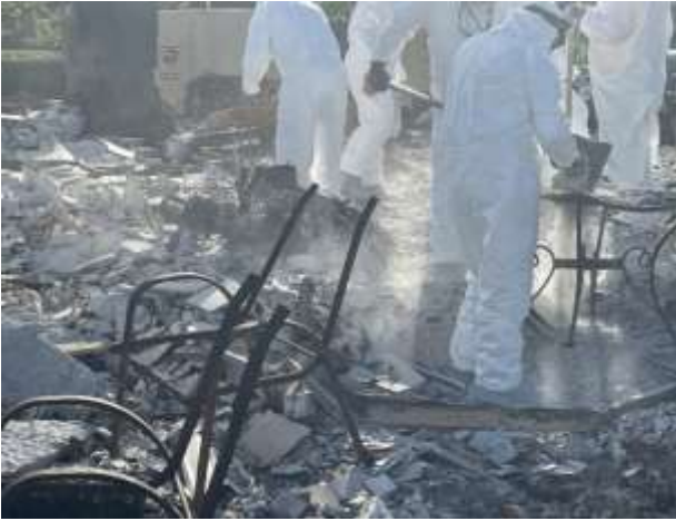
Larawan ng mga grupo sa nasunog na ari-arian na may abo sa paligid; Ang larawan ay kinuha bago ang aplikasyon ng Soiltac.