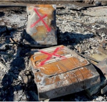
红色油漆=锂电池电源墙或光伏设备。