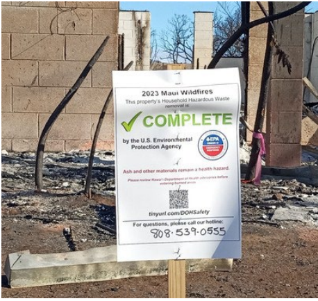
白色标牌和木桩= 现场已清除危险材料 (HM) 并已完成。