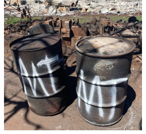
白色“M”标记=燃油箱内容物已转移，燃油箱留在原位。