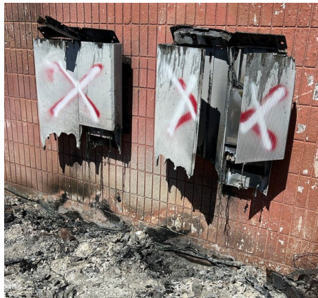
白色斜线覆盖红色油漆=清除的锂电池电源墙或光伏设备。