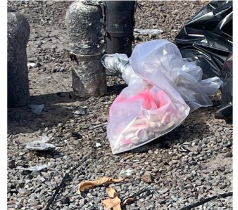
粉红色油漆=疑似含石棉材料。