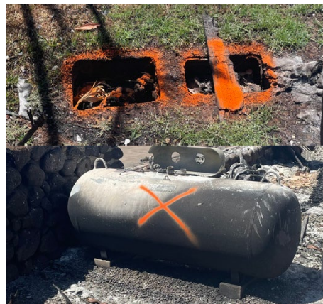
橙色油漆=化粪池系统位置、损坏的变压器或留在现场的高危险物品。