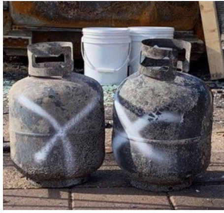
白色油漆或“X”标记=空HM容器或留在原位并将在第2阶段移除的容器。