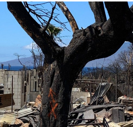
橙色符号 (=, X, +) 在树上=吊架或松散的树枝在大风中可能很危险。保持安全距离。